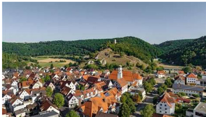
Schelklingen, Gemeinderatssitzung 26.02.2025